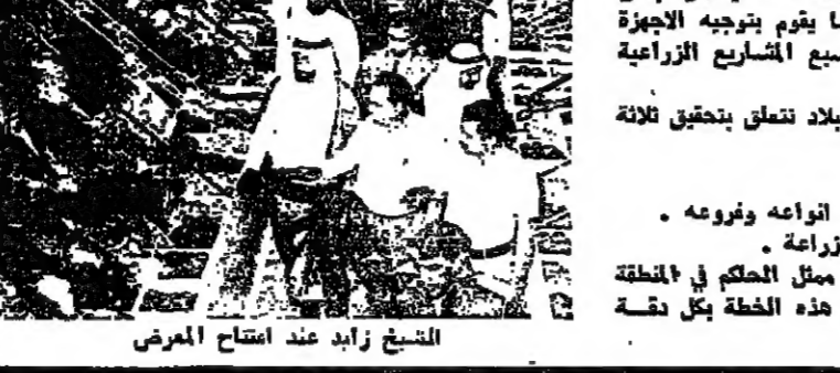
الشيخ زايد عند افتتاح المعرض

انتخب الشيخ زايد بن سلطان آل نهيان رئيس دولة الامارات العربية المتحدة المعرض الزراعي السنوي الثامن في مدينة « العين » بابوظبي الذي دل على التطور الزراعي الموسى والنتائج المشجعة التي وصلت اليها وحققها الايدي الفنية في ابو ظبي لتدعيم احد اهم ركائز الاقتصاد القومي . افتتح المعرض الشيخ زايد بن سلطان آل نهيان رئيس دولة الامارات العربية المتحدة بقائه اذاعة اسلامية كبرى تنبئ شؤون الدعوة الاسلامية والذراع عن قضايا الاسلام ، وتغطي كل بلدان العالم الاسلامي واكثر جزء من الكرة الارضية . الاذاعة المقترحة ستحمل اسم «صوت الاسلام» وسيكون مركزها مكة المكرمة . وقد وافق المجلس التنفيذي على تشكيل لجنة للتخطيط تضم عدداً من المتكلمين المسلمين ، لرسم الخطوط الاساسية للعمل . واوصى المجلس بان تتولى الاذاعات الاعضاء خلية كبرى بإختيار العالم الاسلامي وقضاياه . وستقدم الجمعية العمومية للمنظمة اجتماعتها المقبل في ابو ظبي في ايار ، وعندها .